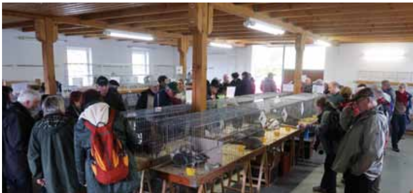
Ausstellungsraum eines Kleintierzuchtverbandes mit Geflügel und Kaninchen

Eine Mitgliedschaft in den Zucht- und Sondervereinen ist eine gute Möglichkeit an