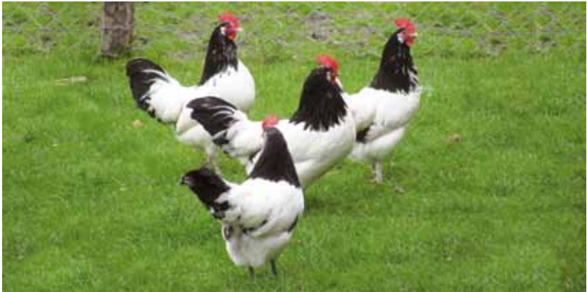
Nachzucht von Hähnen der gefährdeten Geflügelrasse Lakenfelder