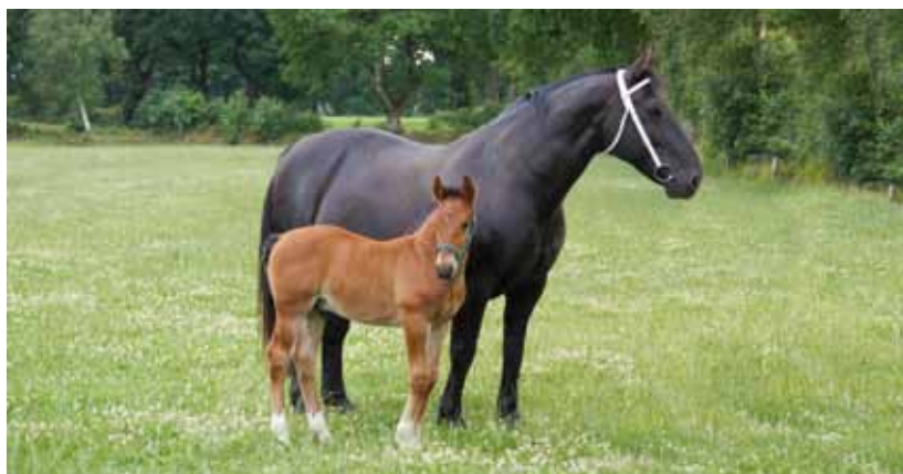
Genetische Diversität innerhalb der Rasse - die schwarze Stute der Altoldenburger Rasse hat ein braunes Fohlen

* eine grundsätzliche Gefährdung ist gegeben