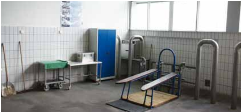
Die Absamung von landwirtschaftlichen Nutztieren unterliegt strengen Auflagen und erfolgt meist in Besamungsstationen mit EU-Zulassung bei mehrwöchigem Verbleib der Tiere im Quarantänebereich