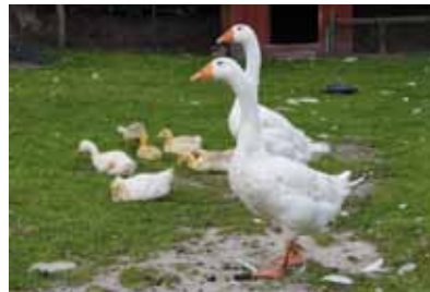
Gänse können sehr alt werden - hier ein Paar Emdener Gänse mit ihren Gösseln