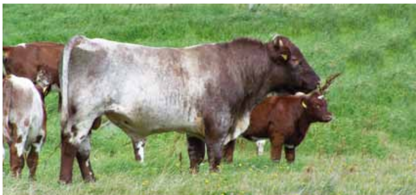
Attraktiver Zuchtbulle der Rasse Deutsches Shorthorn

Bei den meisten gefährdeten Rassen ist die Zahl der männlichen Tiere der den Inzuchtzuwachs am stärksten beeinflussende Faktor. Dies kommt dadurch zustande, dass nicht jede/r Züchter/in die Möglichkeit hat, die Aufzucht männlicher Tiere gewährleisten zu können, da die Haltung von Zuchtebern, Bullen, Hengsten oder Böcken viel Erfahrung, Wissen und ein gutes Herdenmanagement voraussetzt. Um den Inzuchtzuwachs möglichst gering zu halten, muss eine ausreichende Zahl von männlichen Tieren zur Verfügung stehen. Das heißt, dass ein möglichst enges Verhältnis der Geschlechter (männliche Zuchttiere : weibliche Zuchttiere) anzustreben ist. Dies ist dann der Fall, wenn eine große Zahl von Tierhaltern/innen möglichst ein oder mehrere männliche Zuchttiere hält und einsetzt, z. B. pro 20-30 Mutterschafe einen Zuchtbock, pro Geflügelstamm je einen Hahn zu vier Hennen.