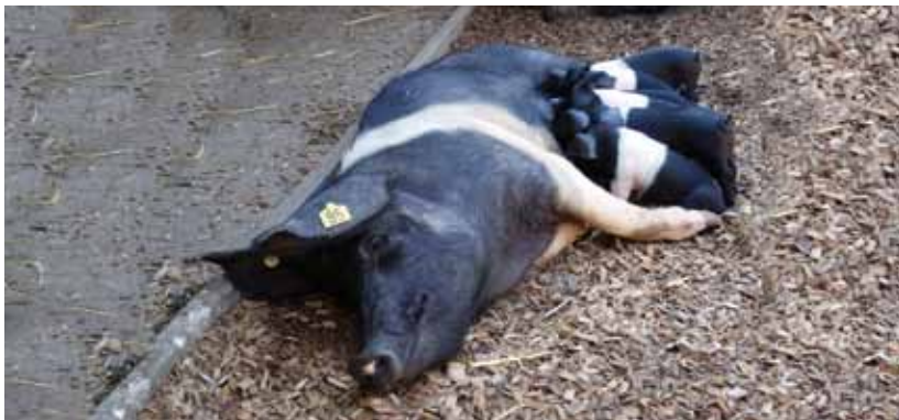
Zuchtsau der Rasse Angler Sattelschwein beim Säugen der Ferkel im Auslauf der Schweineanlage