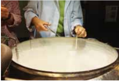
Die Kryokonservierung erfolgt in großen Tanks mit flüssigem Stickstoff und einer gleichbleibenden Temperatur von -196 Grad Celsius

Bei der ex-situ Methode liegt der Schwerpunkt auf der Sicherung der Genetik eines Tieres zu einem bestimmten Zeitpunkt sowie zum Wiederaufbau einer Rasse bei Total- oder Teilverlust durch eine Seuche und andere Vorkommnisse. Eine Gefrierkonservierung ohne gleichzeitige Lebenderhaltung erfüllt die Voraussetzungen für die Erhaltung und Nutzung einer gefährdeten Rasse nicht in ausreichender Weise, ist aber als begleitende Maßnahme zum Rasseerhalt unerlässlich.