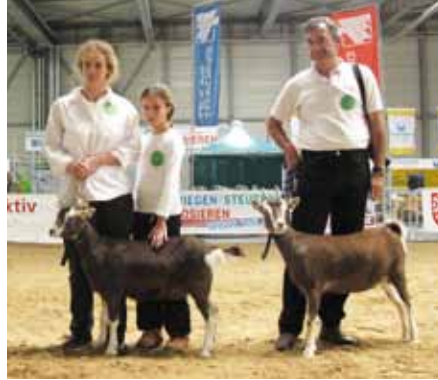
Zusammentreffen der Züchter/innen und Bewertung der Zuchttiere nach den Vorgaben der Zuchtziele sind wichtige Gradmesser des Züchterfolgs

Betrieben immer schwieriger bis unmöglich. Dies spaltet die ohnehin schon kleinen Populationen in getrennte Unterpopulationen auf, mit der Gefahr einer neuen genetischen Verengung. Um all diesen Aspekten gerecht werden zu können und die Züchter zu unterstützen, bedarf es einer guten Koordination der Tierhalterinnen und Tierhalter durch die Zuchtverbände, die GEH-Arbeitskreise, die GEH-Rassebetreuer/innen und Koordinator/innen. Ein Großteil dieser Arbeit wird von ehrenamtlichen Personen geleistet.