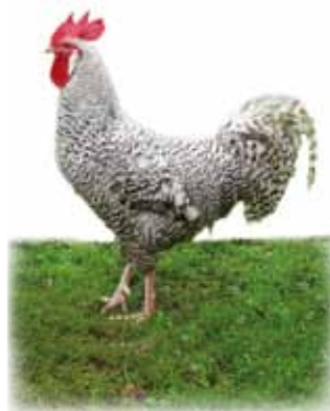
Deutscher Sperberhahn

Bei Hühnern, die meist in Gruppen gehalten werden, ist es sehr aufwendig, die Küken einer bestimmten Mutter zuzuordnen, sofern nicht mit sogenannten Fallnestern gearbeitet wird. Bei diesen Nestern wird der Ausgang aus dem Nest für die Henne automatisch verriegelt. Der Züchter muss entsprechend alle 1-2 Stunden die Nester kontrollieren, das Ei (Brutei) der Henne entsprechend zuordnen und beschriften und schließlich die Henne wieder freilassen. Da dies sehr zeit- und arbeitsintensiv ist, wird die Fallnestkontrolle nur sehr selten in der Hühnerhaltung durchgeführt. Die Konstruktion eines sogenannten elektronischen Fallnestes mit der Möglichkeit der Zuordnung des Eies zu einer Henne durch Erfassung der Uhrzeit über Transponder an der Henne oder optische Erfassung der Henne und danach freier Austritt der Henne aus dem Legenest ist in Erprobungsphase und bisher äußerst kostenintensiv.