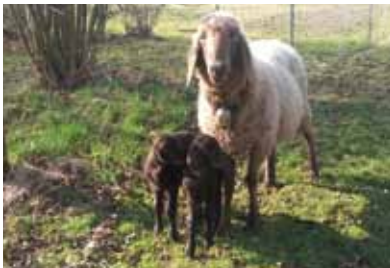
11-jährige Braune Bergschafmutter mit zwei Lämmern

Beim Schaf etwa sollte ein Muttertier durch die eigene Nachzucht in hohem Lebensalter remontiert werden, d.h. das Lamm sollte zur Remontierung des Mutter-tieres im 6. bis 8. Lebensalter der Mutter aufgezogen werden, sofern die Tiere sich dazu gesundheitlich noch eignen. Pferde haben durch ihr höheres Lebensalter grundsätzlich ein längeres Generationsintervall, sodass eine Stute eventuell erst nach 15 bis 20 Jahren durch eine Tochter ersetzt werden sollte.