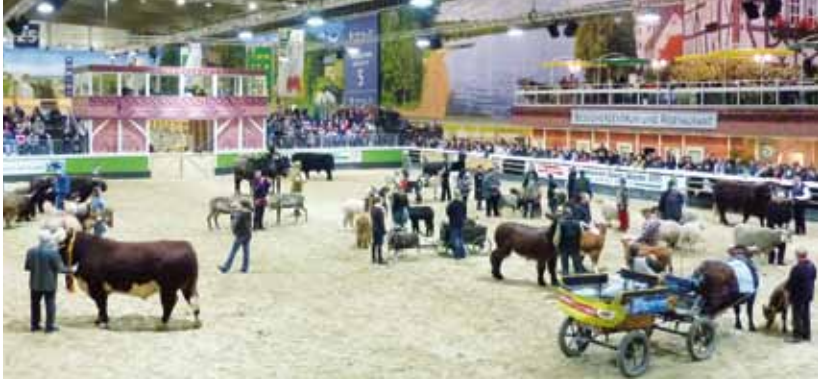
Bundesschauen für Rinder, Schafe und Pferde, wie sie zum Beispiel im Rahmen der Internationalen Grünen Woche Berlin veranstaltet werden, bringen die Zuchtarbeit bei landwirtschaftlichen Nutztieren einem breiten Publikum nah

Diese Informationsbroschüre enthält einen kompakten Einblick in die Grundlagen der Erhaltungszucht für gefährdete Nutztierassen. Sie richtet sich vor allem an Züchterinnen und Züchter, die täglich mit ihren Tieren zu tun haben und Entscheidungen treffen müssen, wie sie die eigene Herde im Sinne des Rasseerhalts organisieren und führen. Wir wünschen allen viel Freude beim Lesen und viel Erfolg mit Ihren Tieren – Ihre GEH