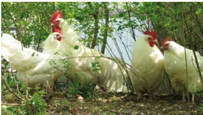
Eine Schar weißer Krüper suchen das schützende Dickicht im Auslauf auf

Bei den meisten Geflügelzüchtern/innen lässt es sich realisieren, dass der Vater (Hahn) für die Gruppe bekannt ist, indem während der Phase der Bruteisammlung jeweils nur ein männliches Zuchttier in der Herde ist. Die verschiedenen Zuchtparameter (Berechnung der Inzucht) werden dann entsprechend über den gesamten Zuchtschlag berechnet, der bei Hühnern in der Regel aus einem Hahn und vier bis fünf Hennen besteht.