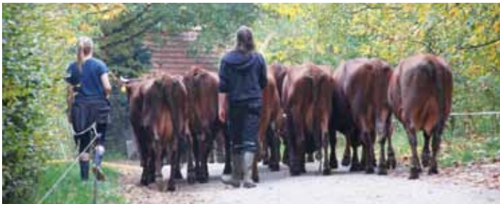
Milchkühe der Rasse Angler Rinder beim Weide- austrieb

In besonderer Weise bieten sich heutzutage die alten Nutztier rassen auch im Sinne von Systemdienstleistungen wie etwa Pflegemaßnahmen im Naturschutz und extensiven Tierhaltungsformen an. Dazu bedarf es auf der einen Seite engagierte Züchter/innen, die die hervorragenden Eigenschaften dieser Nutztier rassen wie Robustheit, Genügsamkeit, Langlebigkeit und die besondere Qualität der Produkte schätzen und auf der anderen Seite Verbaucher/innen, die diese Produkte zu entsprechenden Preisen kaufen und nachfragen.