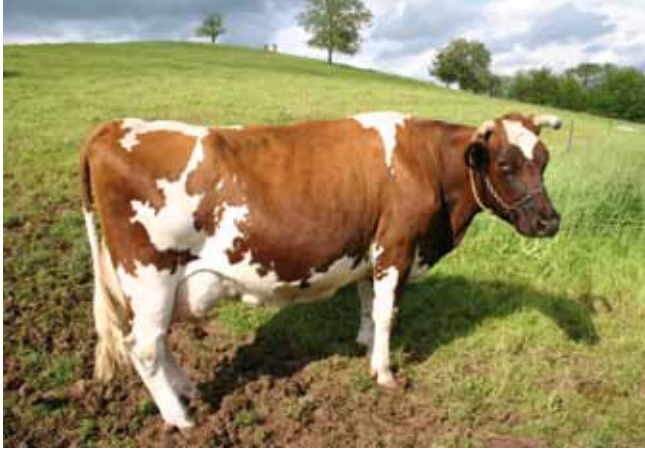
Die 13-jährige Milchkuh der Rasse Rotbunte DN (Doppel- nutzung) hat 10 Kälber zur Welt gebracht

Für die dauerhafte Begrenzung des Inzuchtzuwachses pro Generation ( \Delta F ) empfiehlt es sich das Generationsintervall äußerst lang zu halten. Das ist durch eine möglichst späte Remontierung (Teil der Nachzucht, der die Größe der Herde sichert) der Herde zu erreichen, d.h., dass der Ersatz der Zucht-tiere durch Tochter bzw. Sohn in einem langen Intervall gesteuert wird. Damit einher geht eine auch wirtschaftlich sinnvolle längere Nutzung der Zucht-tiere in Richtung Dauerleistung und Langlebigkeit, die Ziel bei der Erhaltung traditioneller Rassen sein sollte.